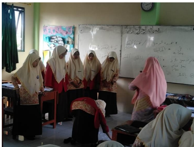
Gambar 5. Guru memberikan Permainan kepada siswa Tentang materi yang telah di jelaskan