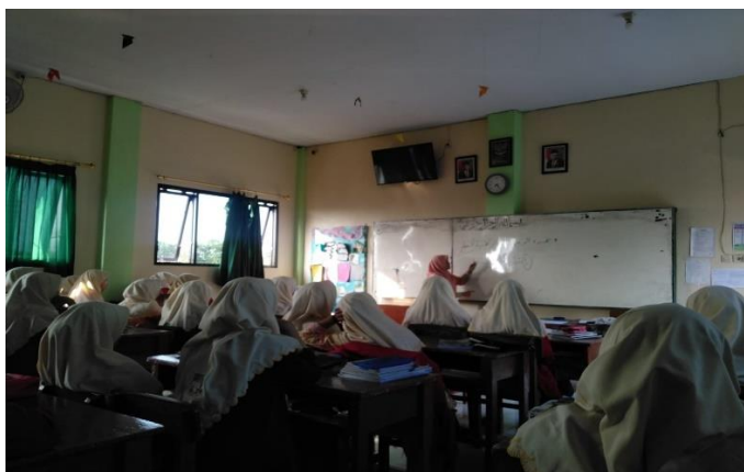
Gambar 3. Guru Bahasa Arab menjelaskan Materi