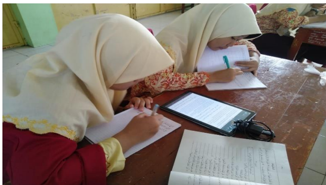
Gambar 4. Murid menyalin ayat Al-qur'an