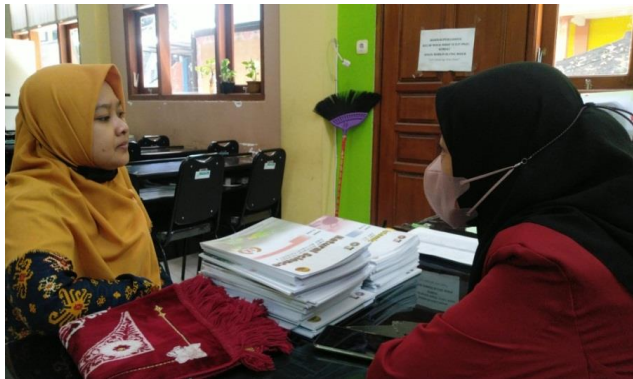
Gambar 1. Wawancara kepada Guru Bahasa Arab Kelas VIII