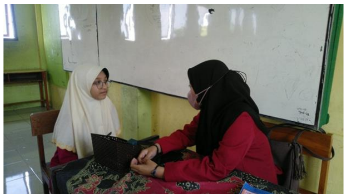
Gambar 2. Wawancara Siswa kelas VIII